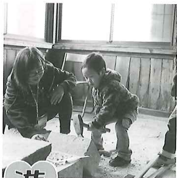
君も今日から石工さん 石切り・石加工体験

今回のイベントでは、各地の石材資源を利活用している方々をお招きして、地域の文化である国見石の魅力やこれからの、楽しみながら考える一時にしたいと考えております。