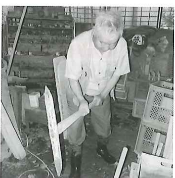
石工さん大集合! 石工座談会