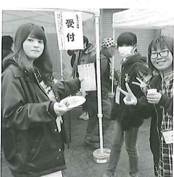
国見石スイーツ produced by 郡山女子大 × 国見町 国見石チョコレート