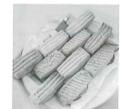
国見石スイーツ produced by 櫻の聖母短大 国見ストーンアツジ