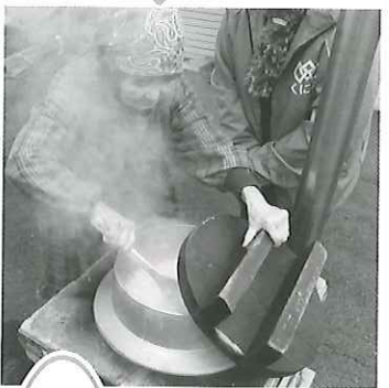
おこげが美味しい 国見石のかまど de ご飯