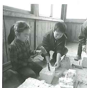
夢のピザ作り体験 石蔵のわがわがを体験 ピザ作り体験 石蔵ミニコンサート