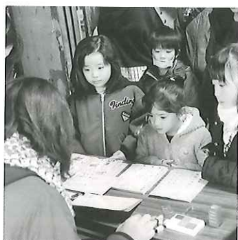
石蔵に隠されたお宝はどこ? 瓦に触ってひびき! 石蔵宝探し 2 瓦葺体験