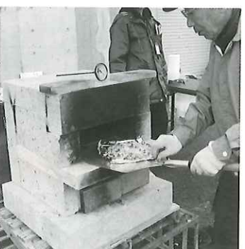
ここしか食べられない絶品の味! 国見石特製石窯ピザ