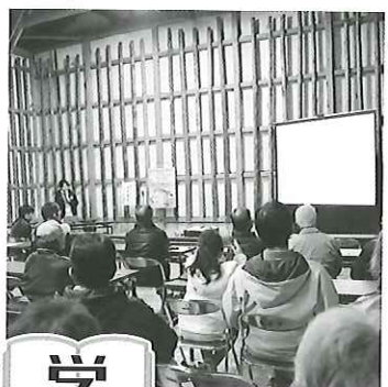
女子大生が教える国見石と石蔵のミッドコ 国見石と石蔵講演会