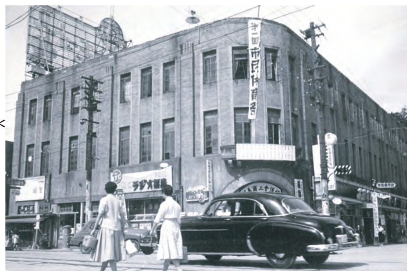
昭和31年(1956)当時の福ビル *