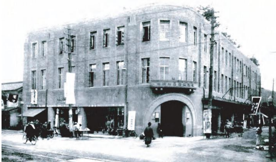
福ビル(「福島案内」昭和6年版より) *